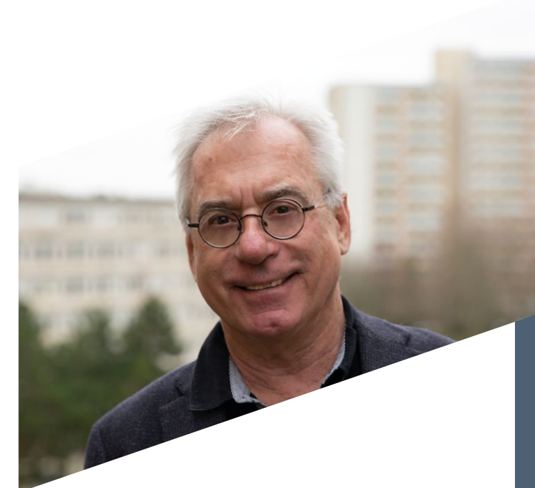
Jean-Luc Dubois-Randé Président de l'UPEC

Cette vision partagée est le fruit d'une réflexion stratégique initiée depuis septembre 2018 qui a largement associé les représentants de la communauté universitaire et les partenaires de l'établissement. Inscrite dans une trajectoire, elle se traduit par des réalisations innovantes et des projets d'avenir ambitieux qui portent plus loin cette dynamique collective.